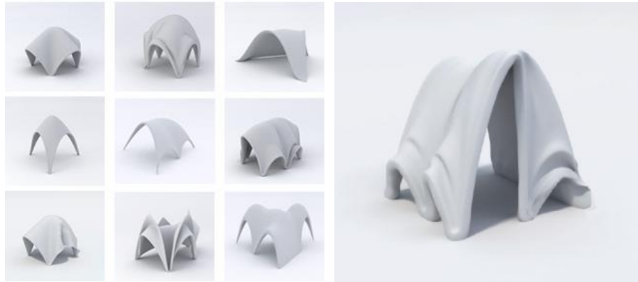
Fig. 4. Untersuchung der Form

In weiterer Folge wurden unterschiedliche Formen untersucht, die im Rahmen eines Umkehrmodells möglich sind. Die Form des Textils sowie die Anzahl und Positionierung der Aufhängepunkte definieren die Größe, Spannweite und Öffnungen des Pavillons. Eine mögliche Anwendung für einen temporären Pavillon wären Garten oder Festival Pavillons, die nach ihrer Nutzung meistens nicht mehr benötigt werden. Nachdem der Pavillon zu 100% kompostierbar ist, fällt kein Abfall an und kann nach seiner Kompostierung wieder als Ressource dienen. Im Gegensatz zu wiederverwendbaren Konstruktionen kann sich der Pavillon durch ein mögliches Verwurzeln mit dem Boden vereinen und so Teil des Ortes werden.