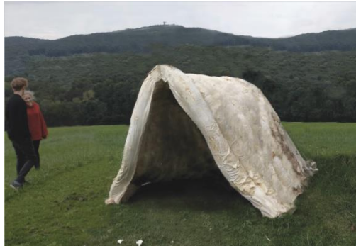
Fig. 2. Trocknungsphase Fig. 3. Rotierter Prototyp