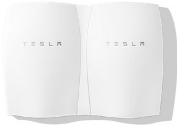
Abb. 2: Tesla-Powerwall

Die Tesla Powerwall wird in zwei verschiedenen Versionen angeboten. Eine für einen 7 kWh-Tageszyklus und eine für den 10 kWh-Wochenzyklus (Tab. 1). Beide haben eine zehn Jahresgarantie und bieten ausreichen Kapazität, um die meisten Privathaushalte während Spitzenlastzeiten mit Strom zu versorgen. Für Anwendungen mit höherem Energiebedarf können 10 kWh-Powerwalls für eine Gesamtkapazität von bis zu 90 kWh in Reihe geschaltet werden. Bei den 7 kWh-Speichern ist eine Reihenschaltung für eine Gesamtkapazität von bis zu 63 kWh möglich. Das Gewicht wird mit 100 kg angegeben und aufgrund der Abmessungen sollten die Powerwall in jeden Raum, die Statik vorausgesetzt, montiert werden können (Tesla Motors Inc., 2015).